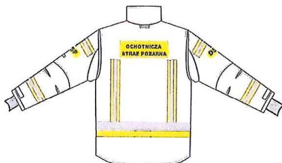
Przykładowy widok kurtki