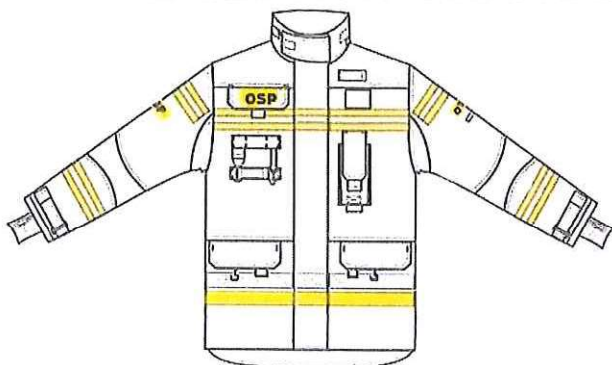
Przykładowy widok kurtki